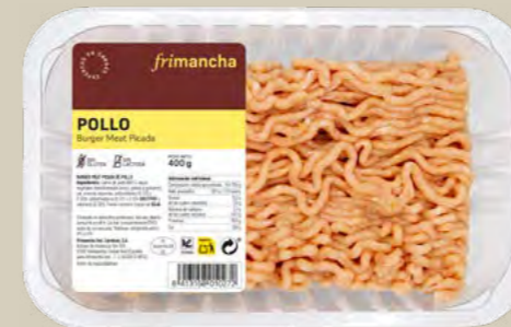
50307B BURGER MEAT PICADA POLLO BTA. 400 G