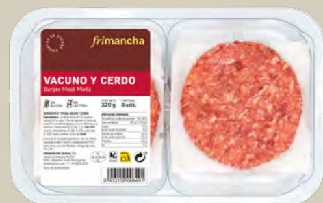
50171B BTA. 4 UD. BURGER MEAT FRESCA 320 G