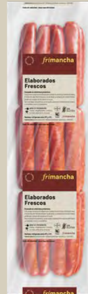
50030P LONGANIZA FRESCA ROJA TRIPA NATURAL