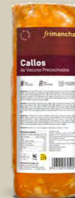
54010P CALLOS VACUNO PRECOCINADOS