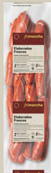
50200P CHORIZO CASERO ROJO