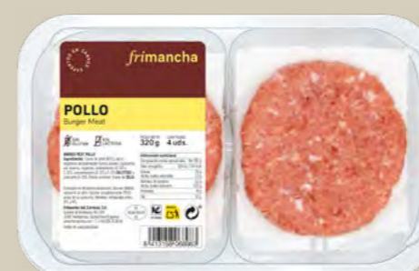
50153B BTA. 4 UD. BURGER MEAT POLLO 100% 320 G