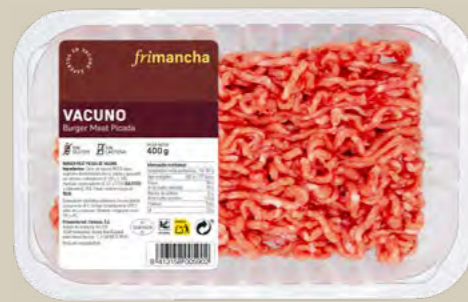
50303B BURGER MEAT PICADA VACUNO BTA. 400 G