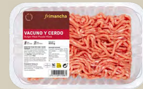
50313B BURGER MEAT PICADA MIXTA BTA. 800 G