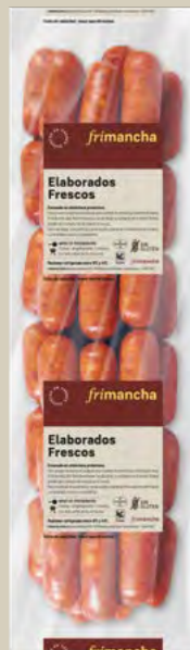
50210P CHORIZO CASERO ROJO PINCHO