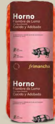
51030P FIAMBRE LOMO COCIDO ADOBADO HORNO