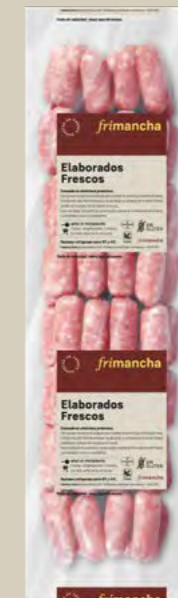
50060P LONGANIZA FRESCA BLANCA COCKTAIL