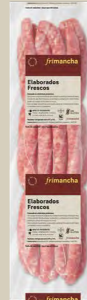
50000P LONGANIZA FRESCA BLANCA