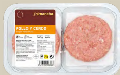
50110P BURGER MEAT FRESCA MIXTA POLLO