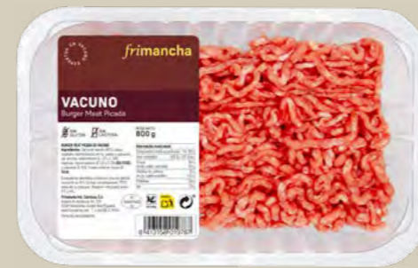
50312B BURGER MEAT PICADA VACUNO BTA. 800G