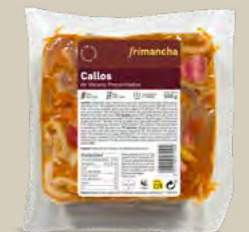
54020P CALLOS VACUNO 500 G