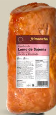
53300P FIAMBRE LOMO SAJONIA COCIDO Y AHUMADO