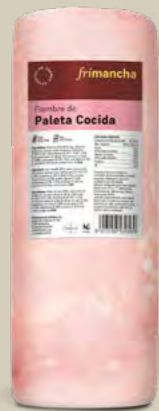
52350P FIAMBRE PALETA PEÑAMAYOR 11X11