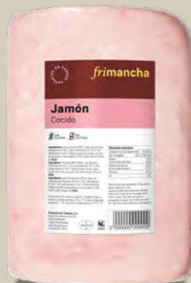
52390P JAMÓN COCIDO FRIMANCHA