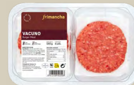
50180P BURGER MEAT FRESCA VACUNO