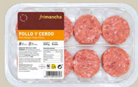
50142B BTA. MINI BURGER MIXTA POLLO 200G