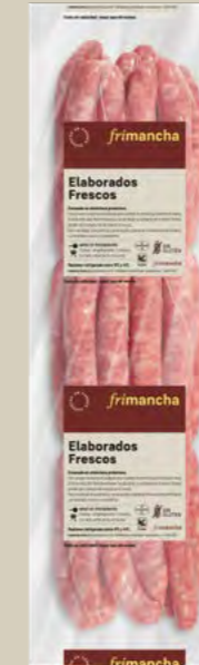
50010P LONGANIZA FRESCA BLANCA TRIPA NATURAL