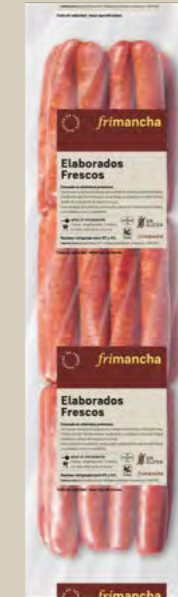
50020P LONGANIZA FRESCA ROJA