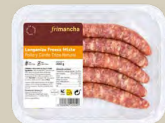
50053B BTA. LONGANIZA FRESCA POLLO TRIPA NATURAL