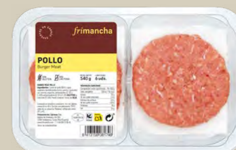
50159B BTA. 6 UD. BURGER MEAT POLLO 100% 540 G