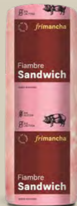
52350P FIAMBRE SANDWICH