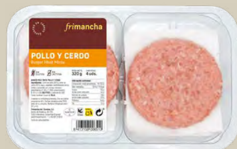
50140B BTA. 4 UD. BURGER MEAT MIXTA POLLO 320 G