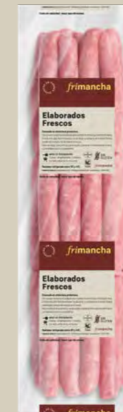
50053P LONGANIZA MIXTA POLLO TRIPA NATURAL