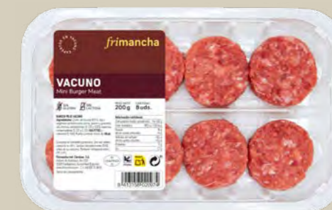
50184B BTA. MINI BURGER VACUNO 200G