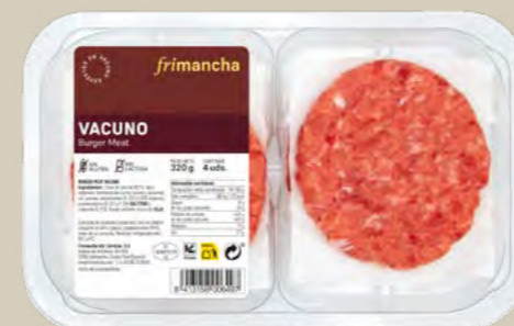
50180B BTA. 4 UD. BURGER MEAT 100% VACUNO 320 G