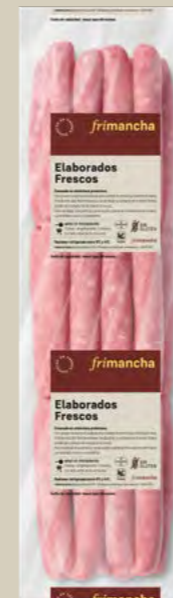
50050P LONGANIZA FRESCA MIXTA POLLO