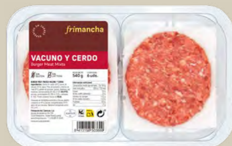
50190P BURGER MEAT FRESCA