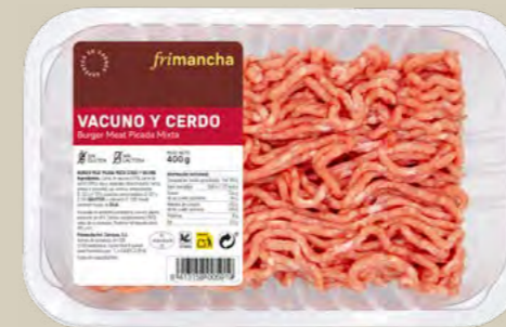
50304B BURGER MEAT PICADA MIXTA BTA. 400 G