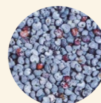
Semillas amapola azul