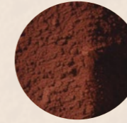
Selectost barley H68 - FUERTE