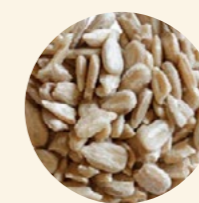
Semillas girasol peladas