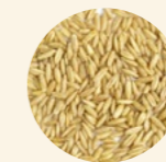
Perla de avena