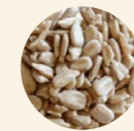
Semillas girasol peladas