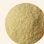
Sémola fina de trigo duro