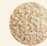
Semillas sésamo pelado