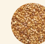
Semillas sésamo tostado