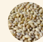
Perla de cebada