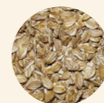
Copos de centeno