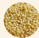
Semillas mijo pelado