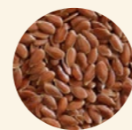
Semillas lino marrón