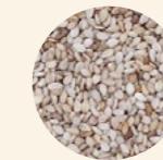
Semillas sésamo natural