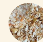
Trigo sarraceno troceado