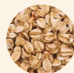
Copos de avena