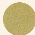
Sémola extrafina de trigo duro