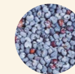
Semillas de amapola azul