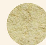
Sémola media de trigo duro