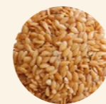
Semillas lino dorado